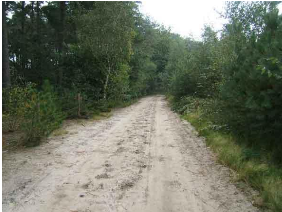
Een van de vele mooie zanderige paden

We overnachten op camping “Wildertse Rust” in Wildert. Staf kent deze camping goed want hij heeft er vroeger nog een stacaravan gehad. Vandaag hebben we zowat 20 kilometer afgelegd.