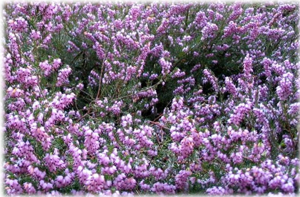
Heidekruid in volle bloei