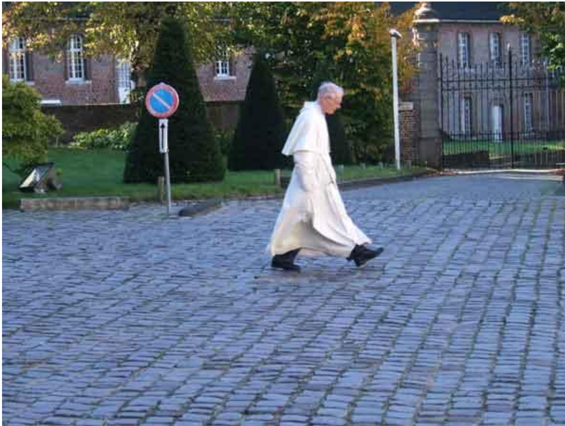
Een witte pater of zoiets.....