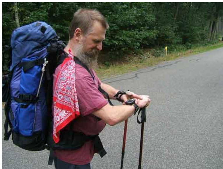
Staf bekijkt zijn armbandGPS en ziet dat het goed zit

Wij stappen meteen de bosjes in. Ondanks het weekend is zien we maar weinig wandelaars.