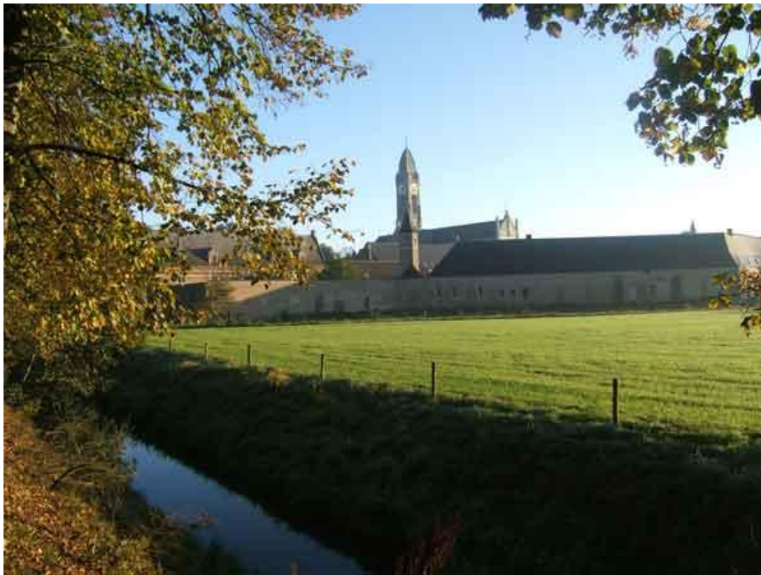
Abdij van Tongerlo