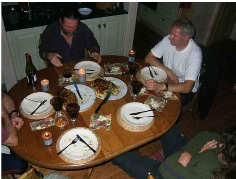
We hebben allemaal ons bord leeg gegeten zoals het een echte Vlaming past