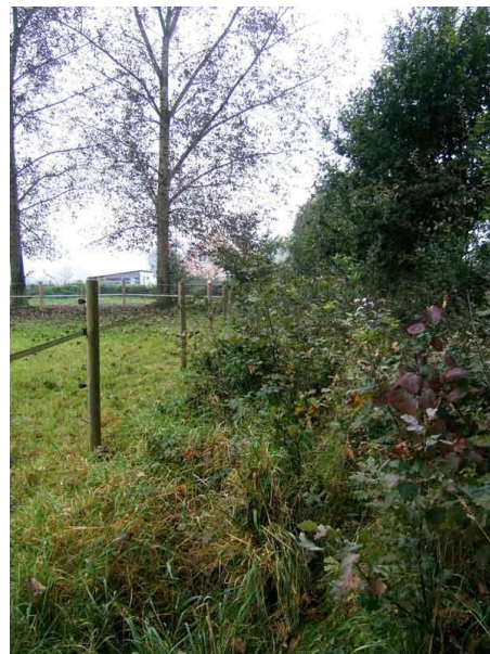
Het is misschien niet goed te zien maar hier loopt het pad van de GR5