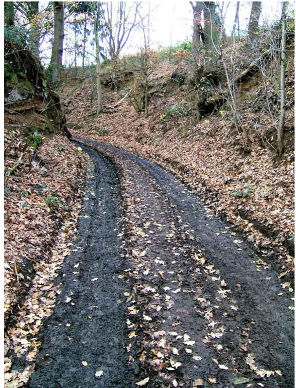
Een van de vele, mooie holle wegen op onze weg