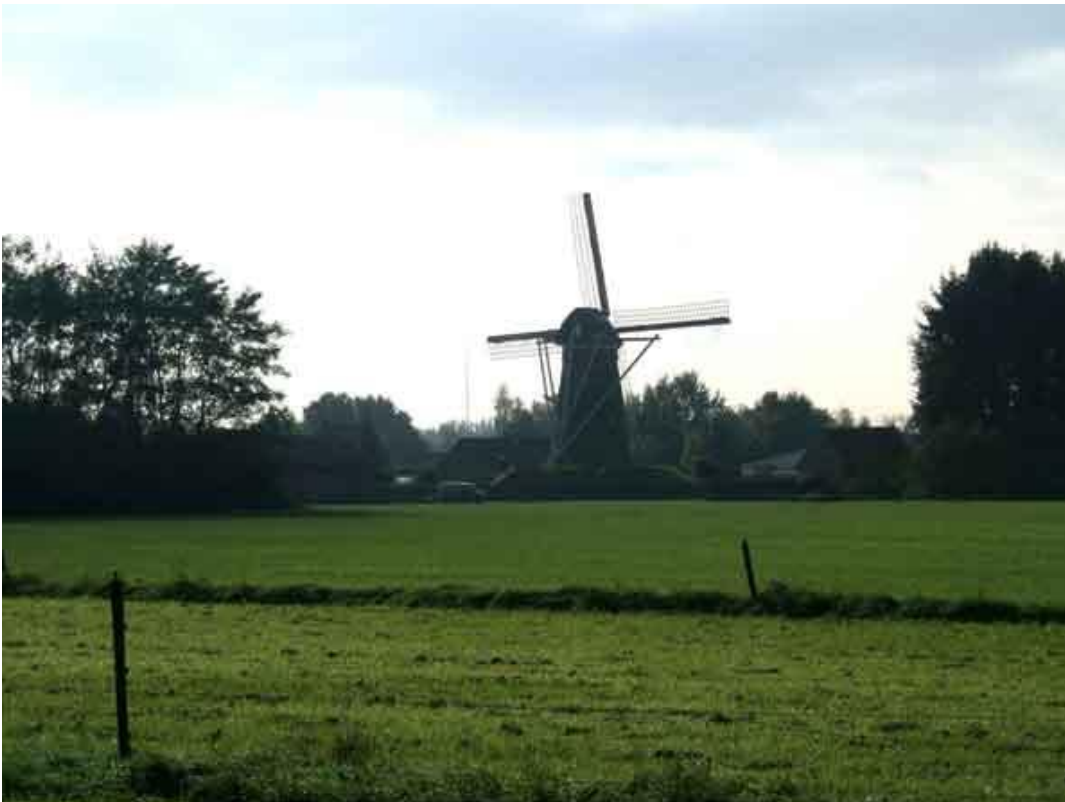
De windmolen van Pulderbos. Het is een nog werkende stenen berg- of beltmolen uit 1853