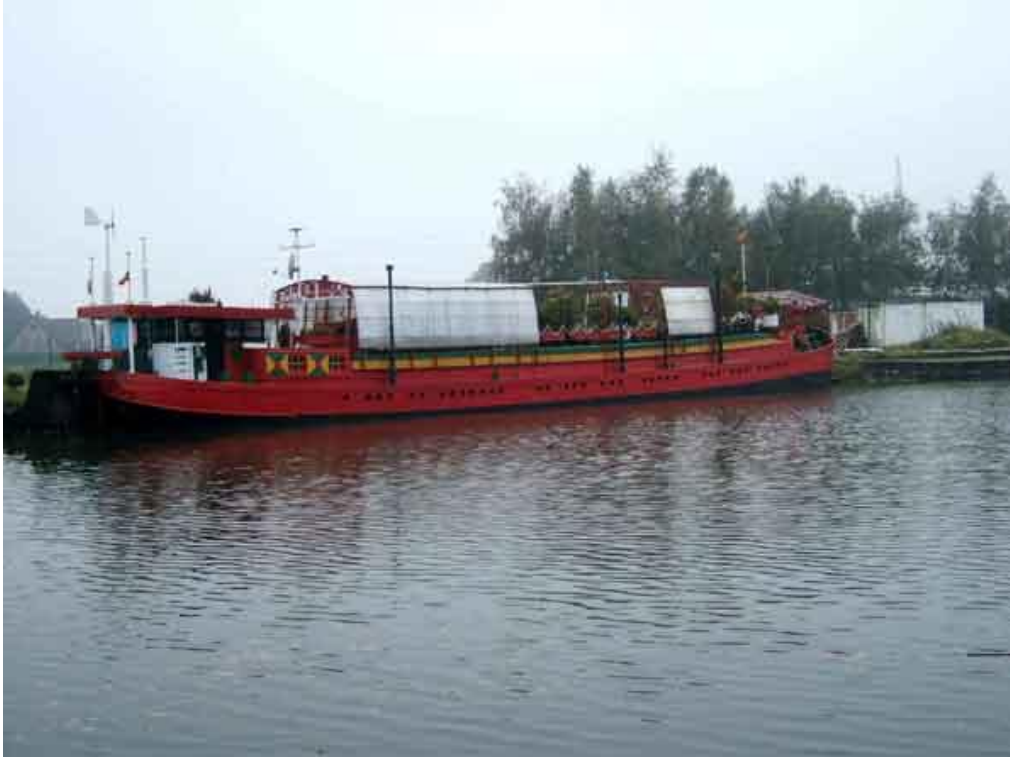
Een woonboot of zoiets op het kanaal Schoten-Turnhout, ook wel Schotenvaart genoemd