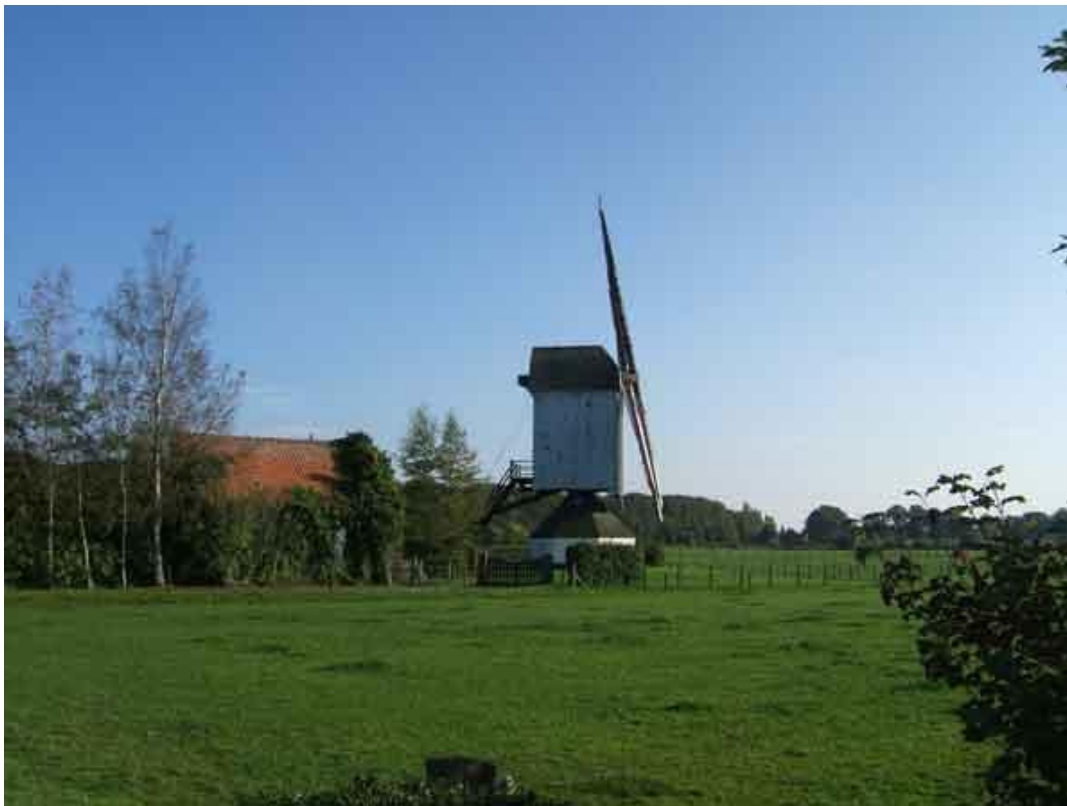
De Hogewegmolen van Noorderwijk