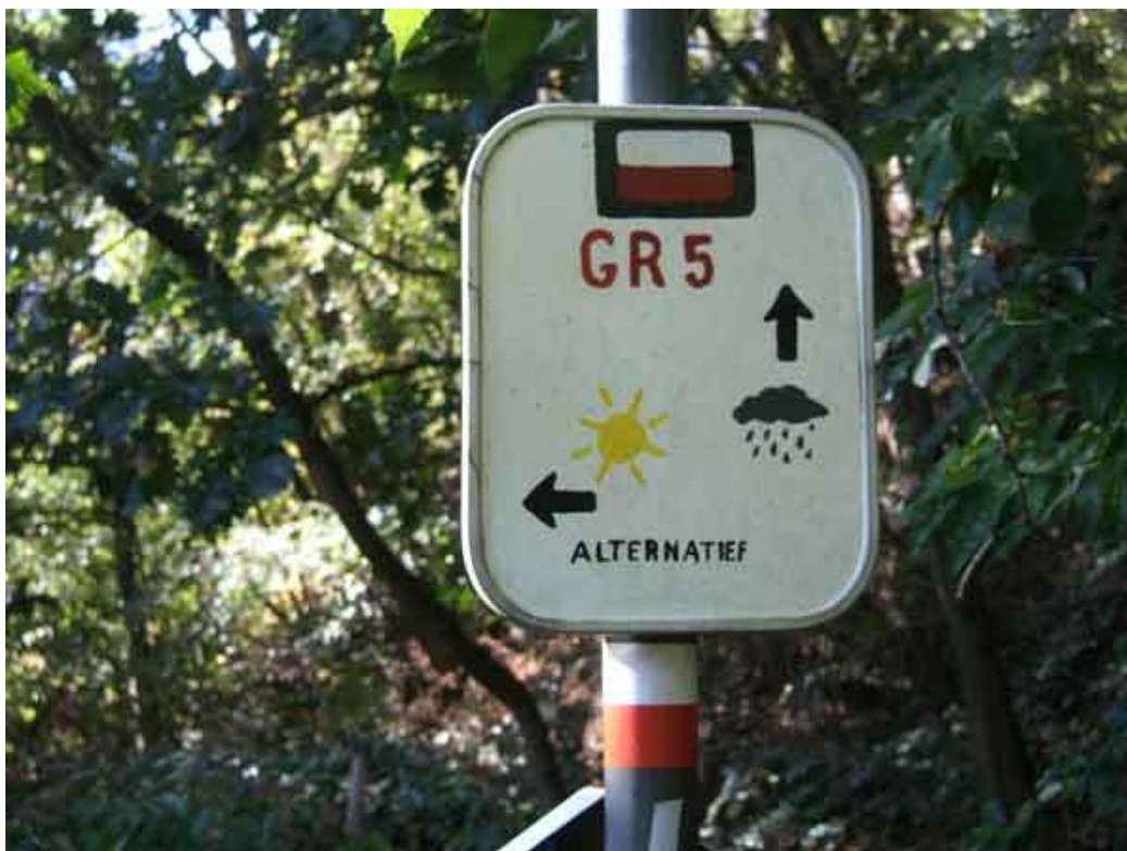
Hier is het links natuurlijk!