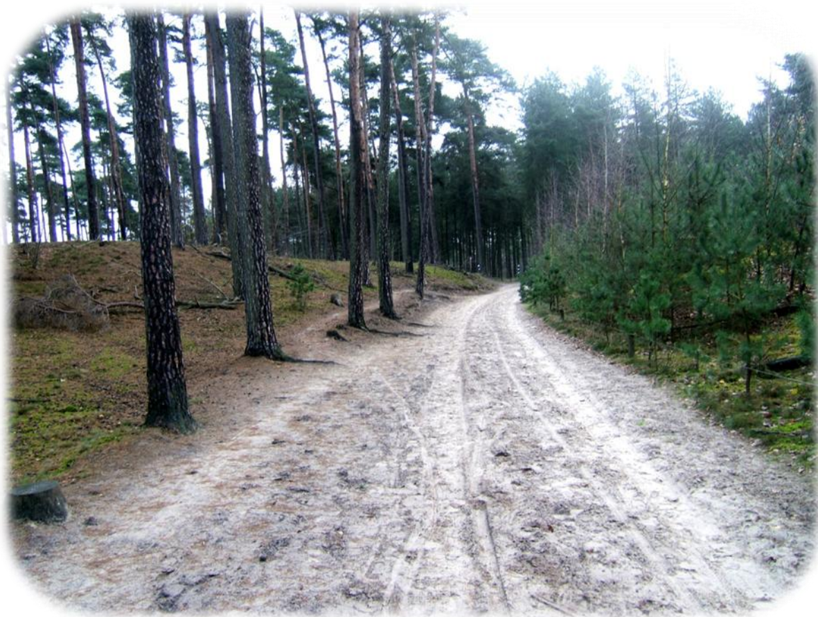
Bolderberg - het hoogste punt van Limburg.