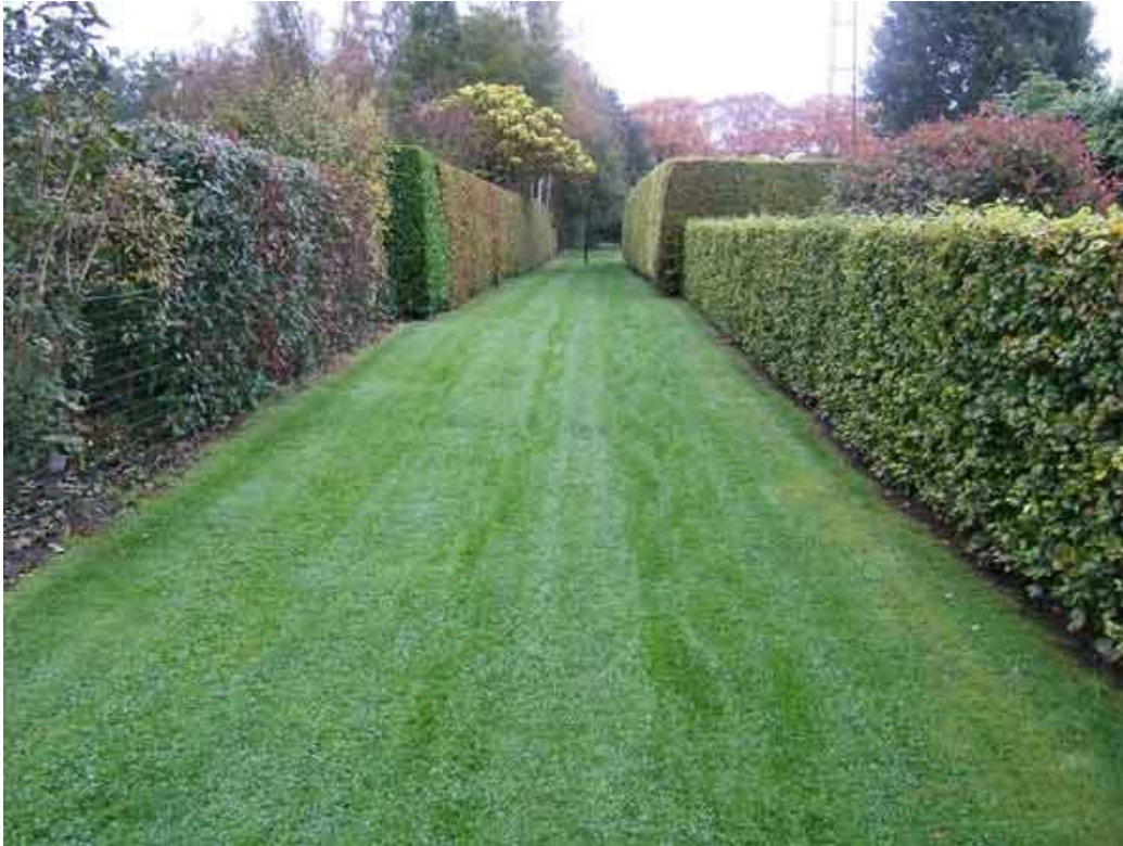
Geloof het of niet maar hier loopt het GR5pad!