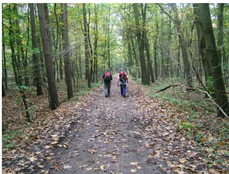
Staf en Frans zijn druk in gesprek in het mooie Zoerselbos