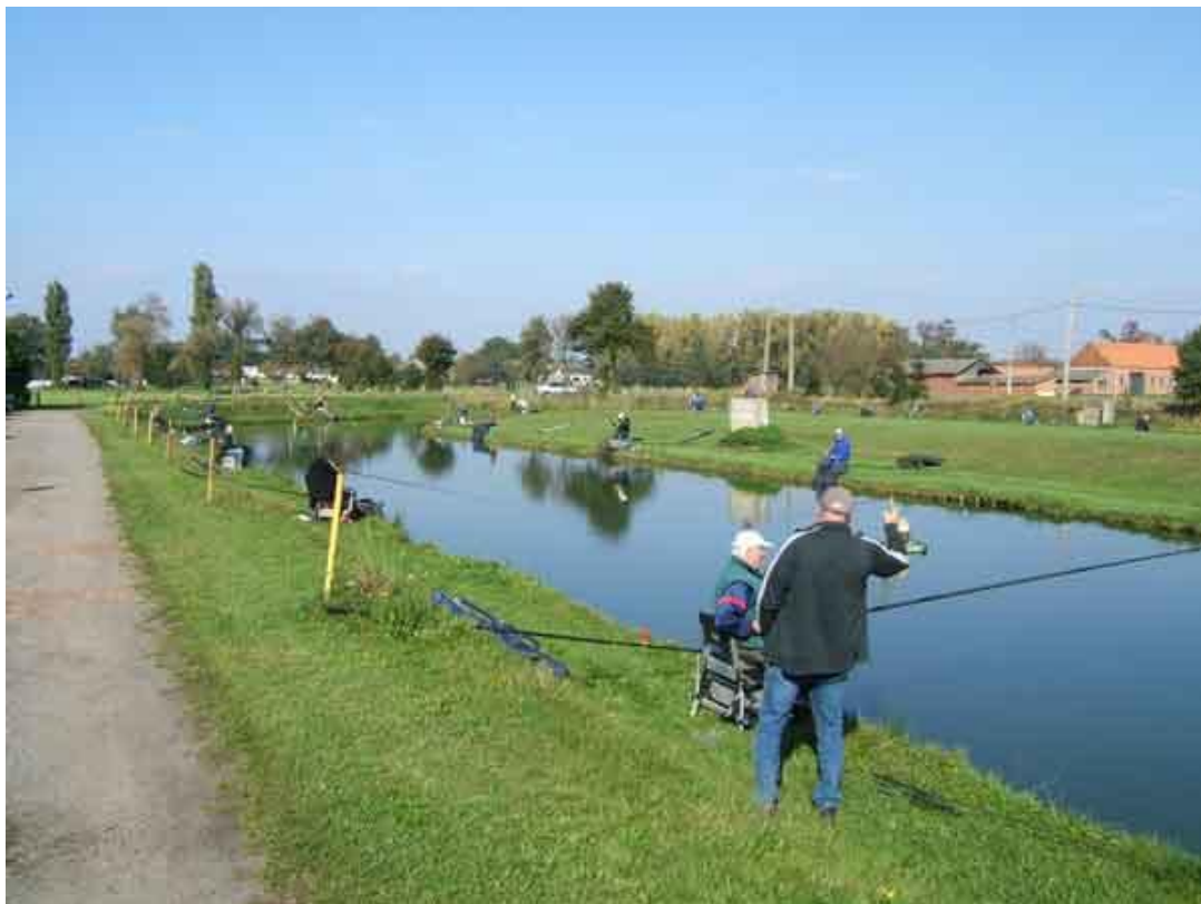
De visvijver van Grobbendonk heeft veel aantrek