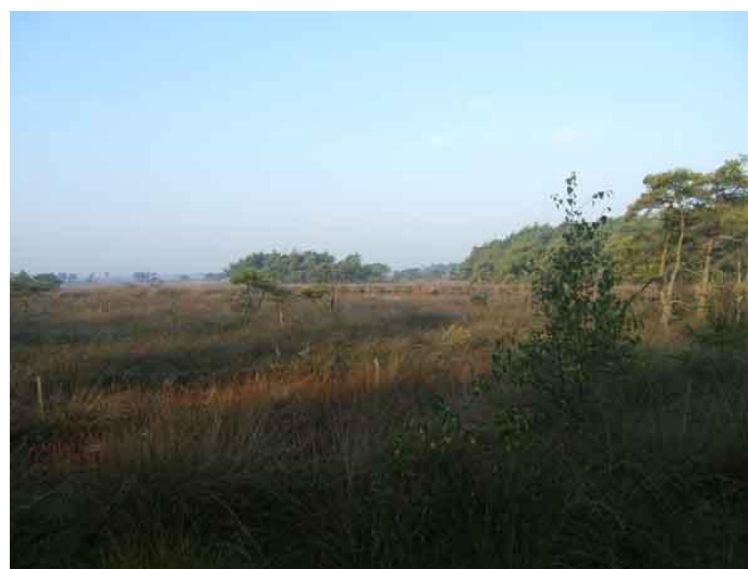
Op weg naar de Kalmthoutse heide