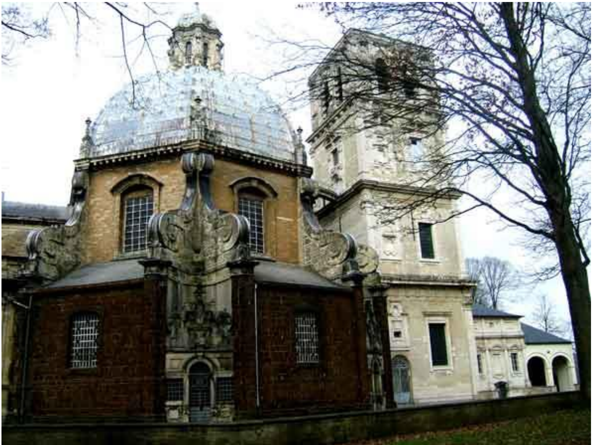
Basiliek van Scherpenheuvel