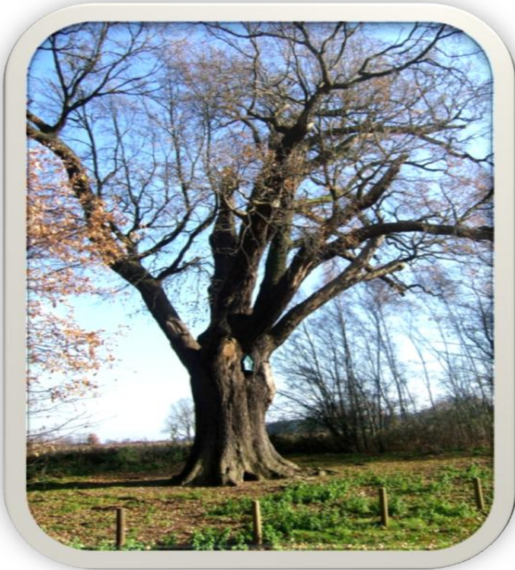
De duizendjarige eik in Lummen heeft een omtrek van 6,20 meter