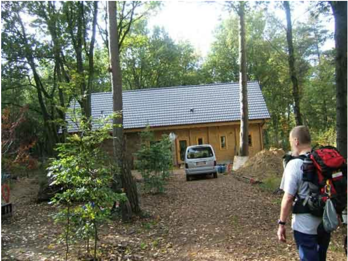
We naderen ons gastenverblijf, een reuzenchalet midden in het bos