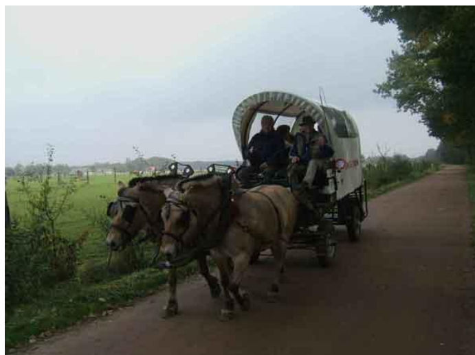
We zijn blijkbaar niet de enige toeristen