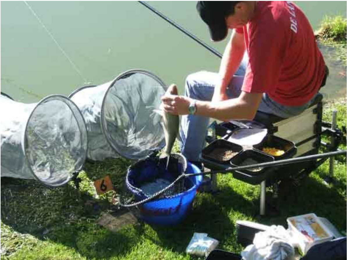
Ja hoor, een flinke brasem!