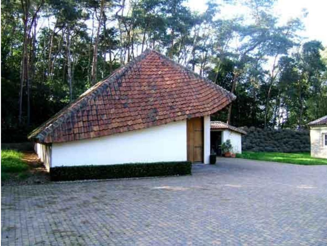
Het hoeft niet altijd recht te zijn om mooi te zijn