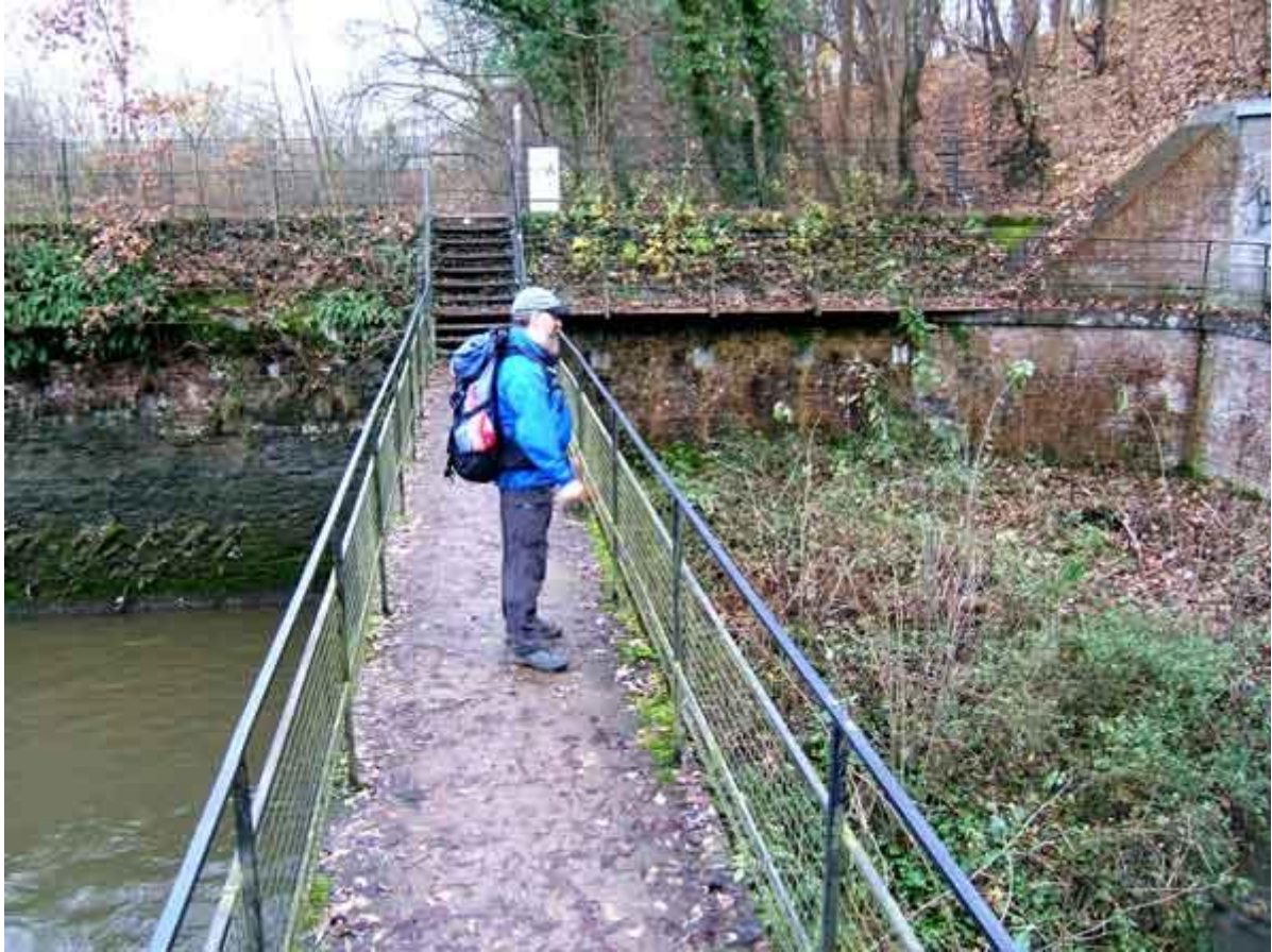
Staf vindt het een prachtige omwalling