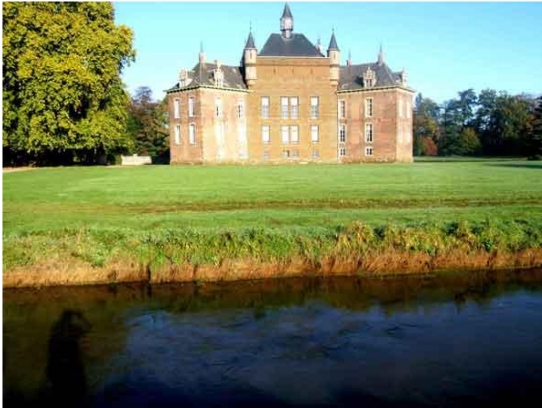
Het kasteel de Merode aan de oever van de Grote Nete te Westerlo