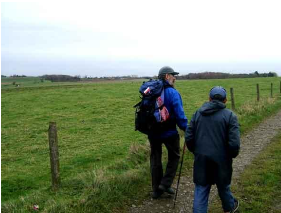
Staf in gesprek met een inwoner van Scherpenheuvel

In de buurt van Scherpenheuvel zijn we even de weg kwijt. Meteen worden we er aangesproken door een 76 jarige man die ons wil helpen. Wij denken, die brave man heeft waarschijnlijk nog nooit van de GR5 gehoord. Maar niets is minder waar. Hij kent de GR5 maar al te goed en leidt ons meteen naar de goede richting. Hij moet wel onze richting niet uit maar stapt toch een half uurtje met ons mee.